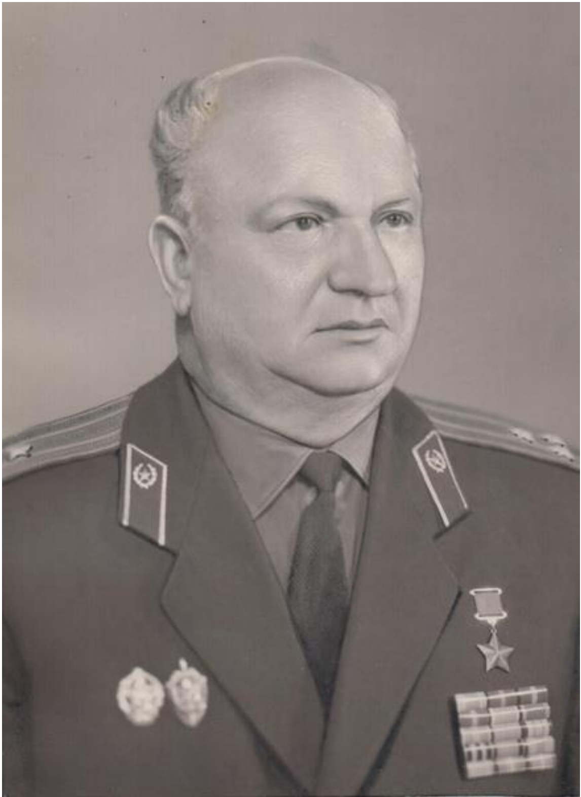
Рис. 11. Кузьма Федорович Ветчинкин – Герой Советского Союза