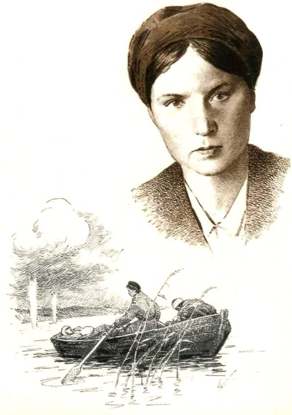
Рис. 4. Марсева Зинаида Ивановна – Герой Советского Союза