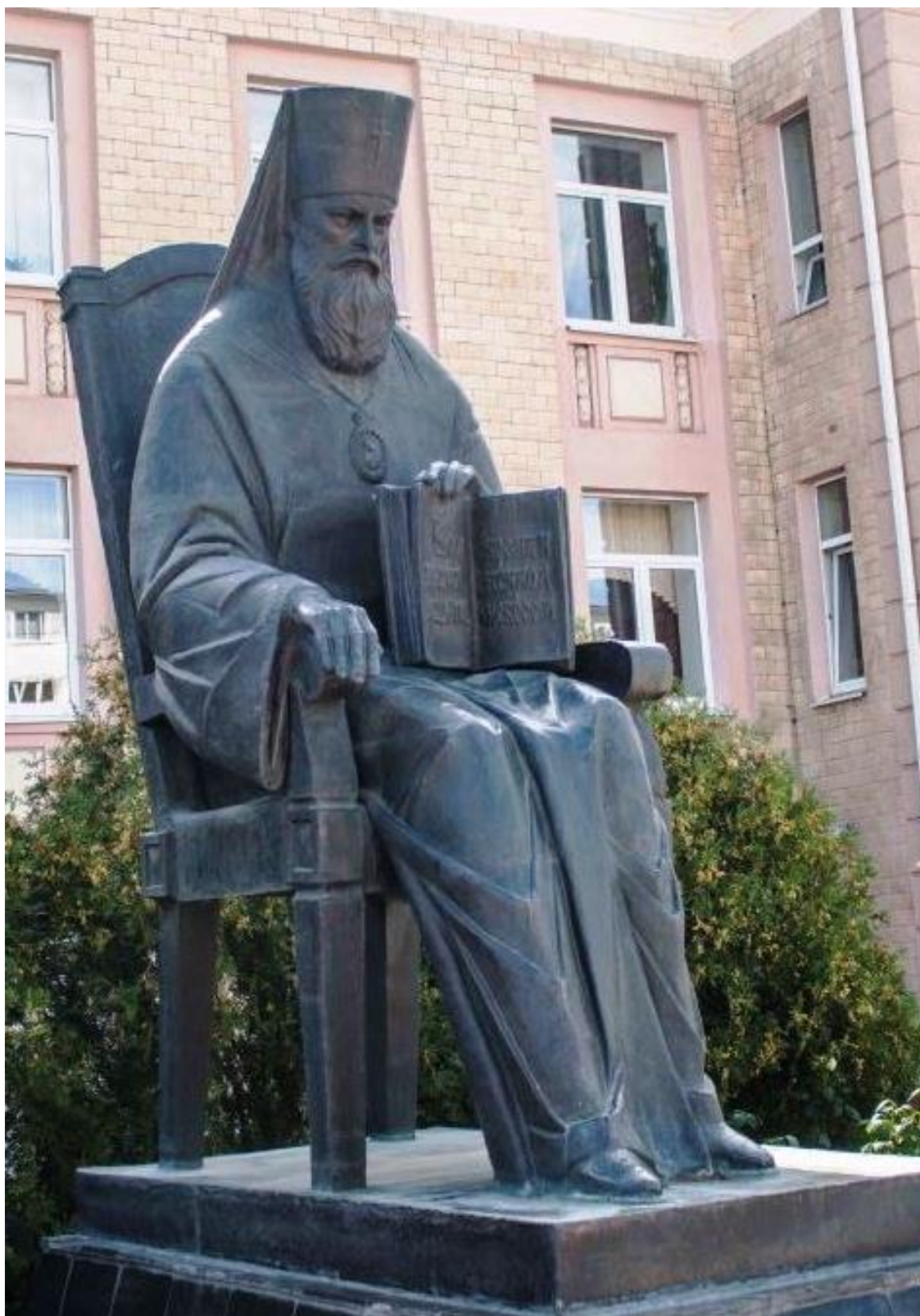
Рис. 7. Памятник Митрополиту Макарию в г. Белгород