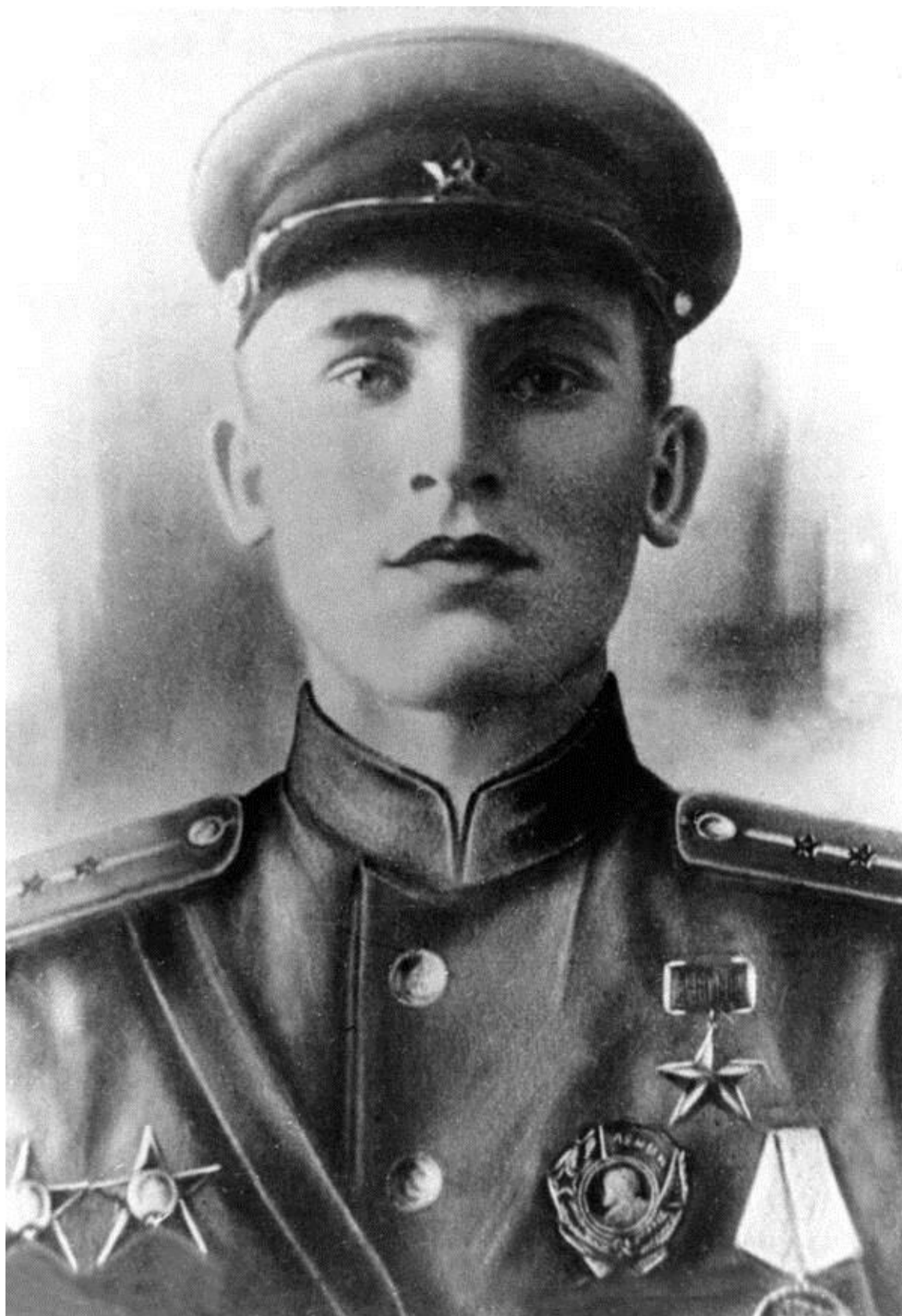
Рис. 2. Бельгин Андрей Антонович – Герой Советского Союза