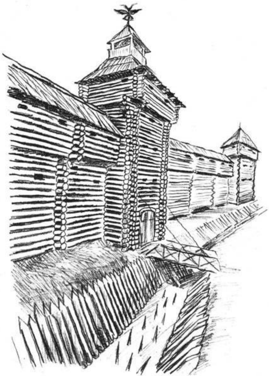
Рис. 6. Крепость Нежегольск