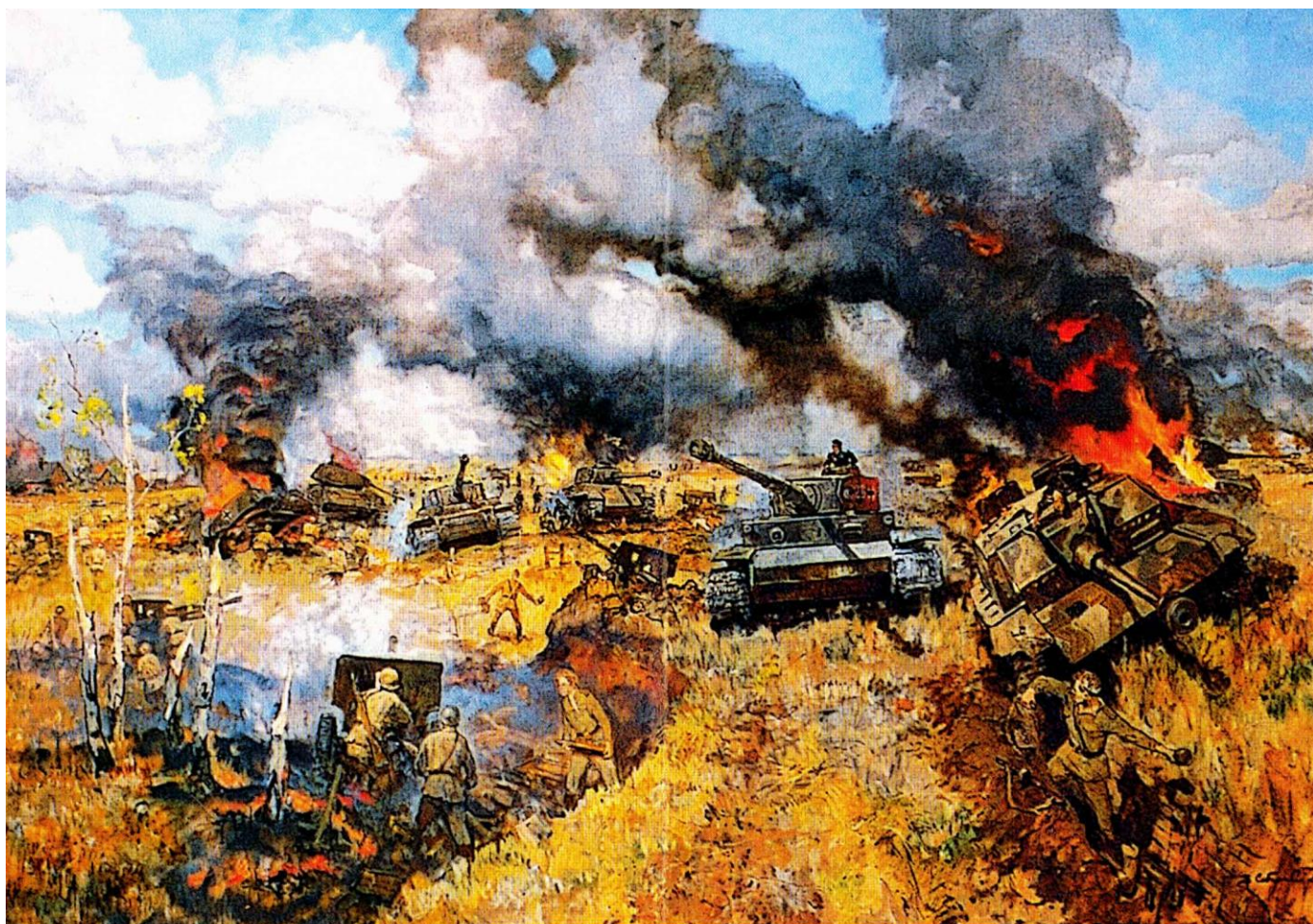
Подвиг бойцов батальона капитана Бельгина 2003. Холст. Масло. 180 × 270