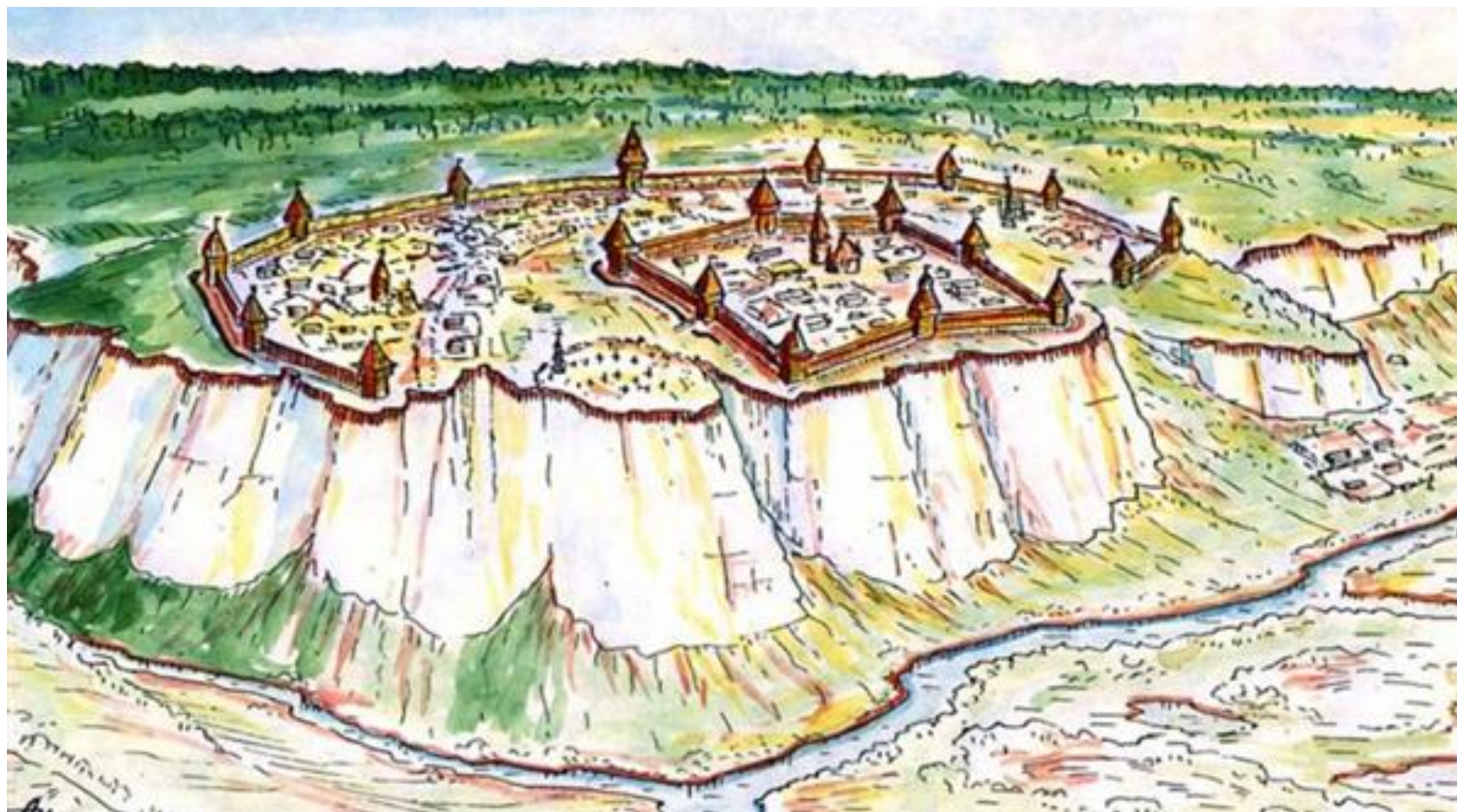
Рис. 1. Крепость Белгород на Белой горе