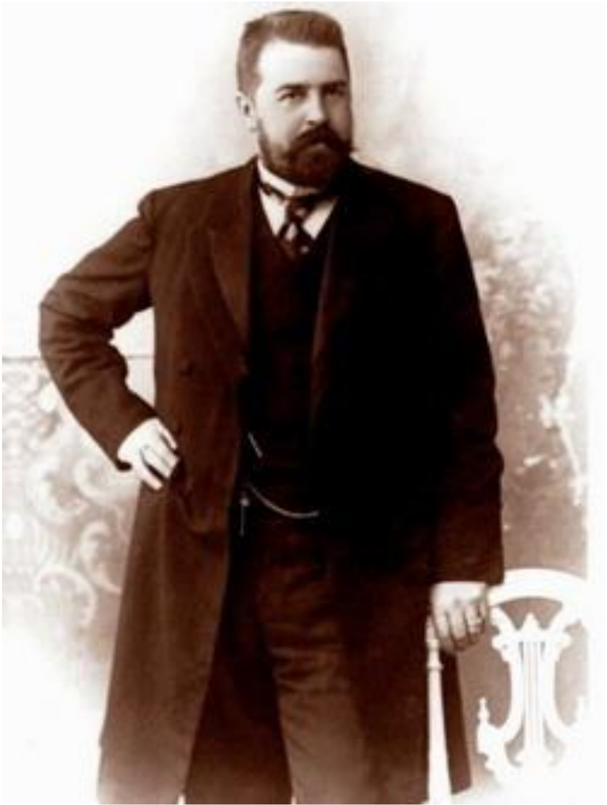
Рис. 5. Ребиндер Алексей Максимович