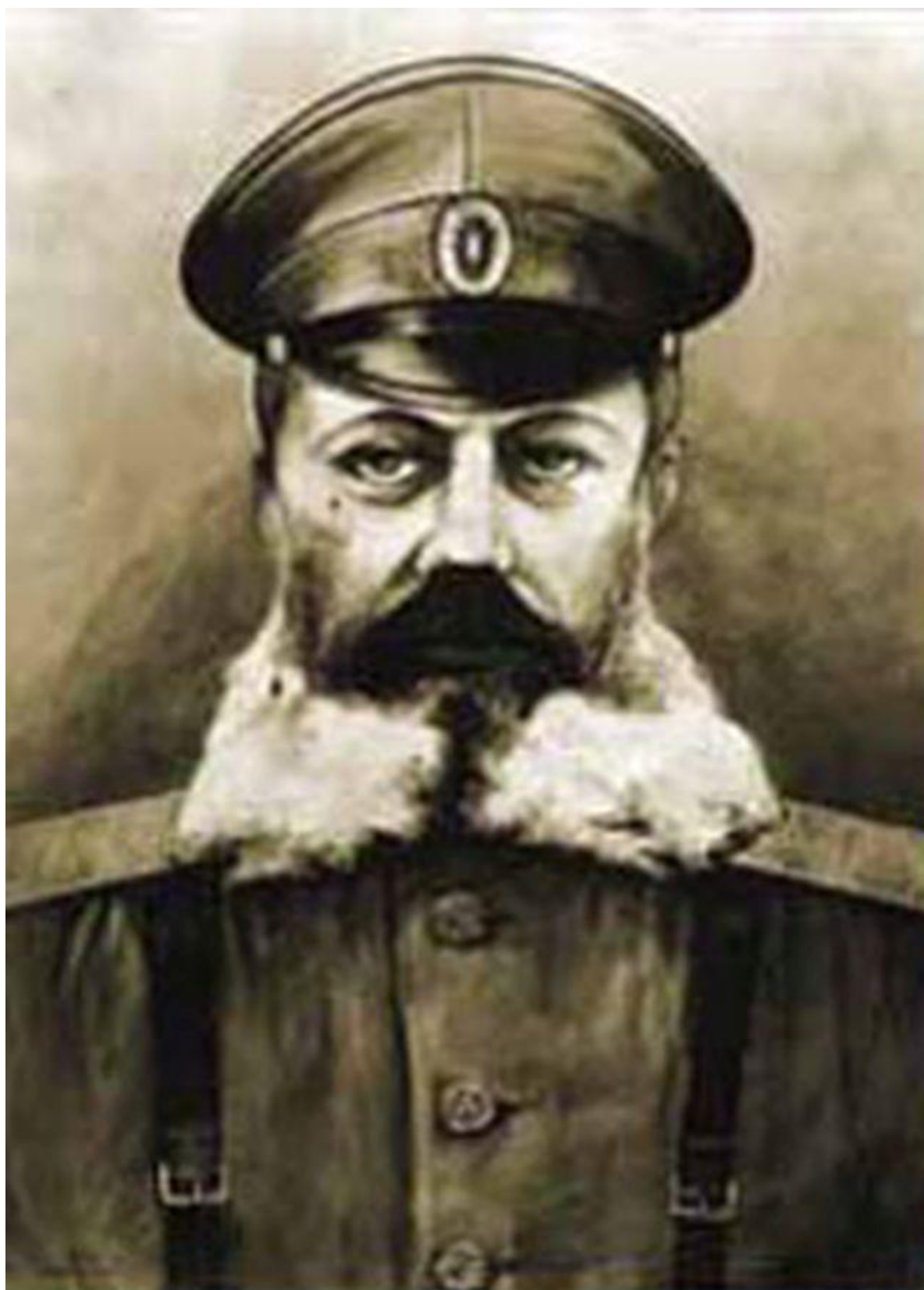
Рис. 9. Шидловский Михаил Владимирович - авиаконструктор